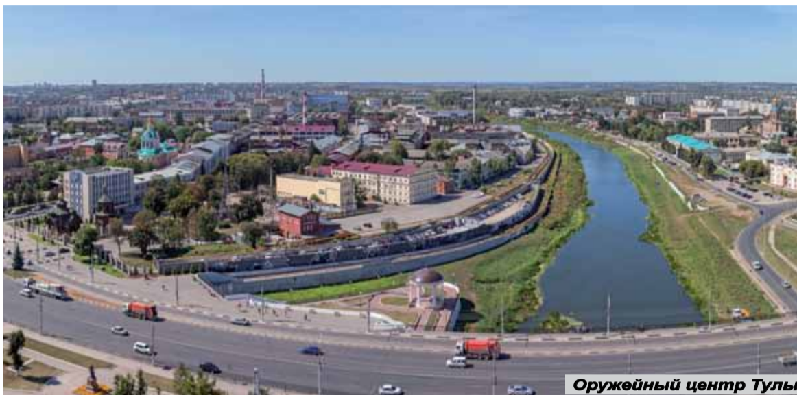
Оружейный центр Тулы

– Вспоминается 1994 год, когда профсоюз оборонщиков активно помог сохранить тульский ОПК, выступив около белого дома в Москве с лозунгом разрешить тулякам внешнеэкономическую деятельность. Настоящее революционное требование, согласитесь!