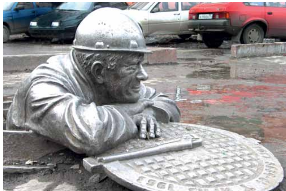
Подобные памятники установлены в десятках городов России и Европы. Не пора ли и Туле увековечить нелегкий труд слесаря Степаныча?